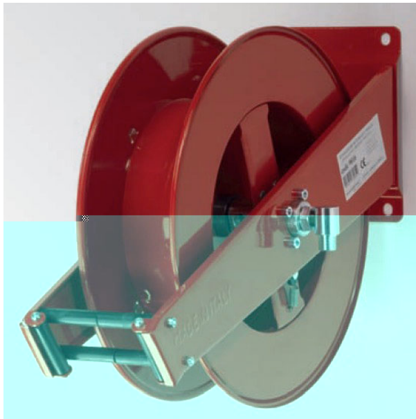
Modèle GEPRO F016 acier peint