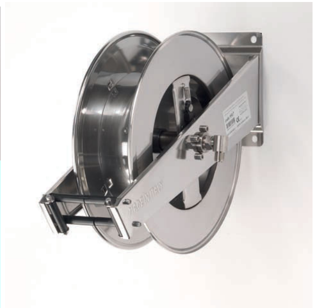
Modèle GEPRO F516 inox AISI 304