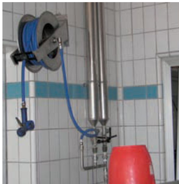
GEPRO version Inox