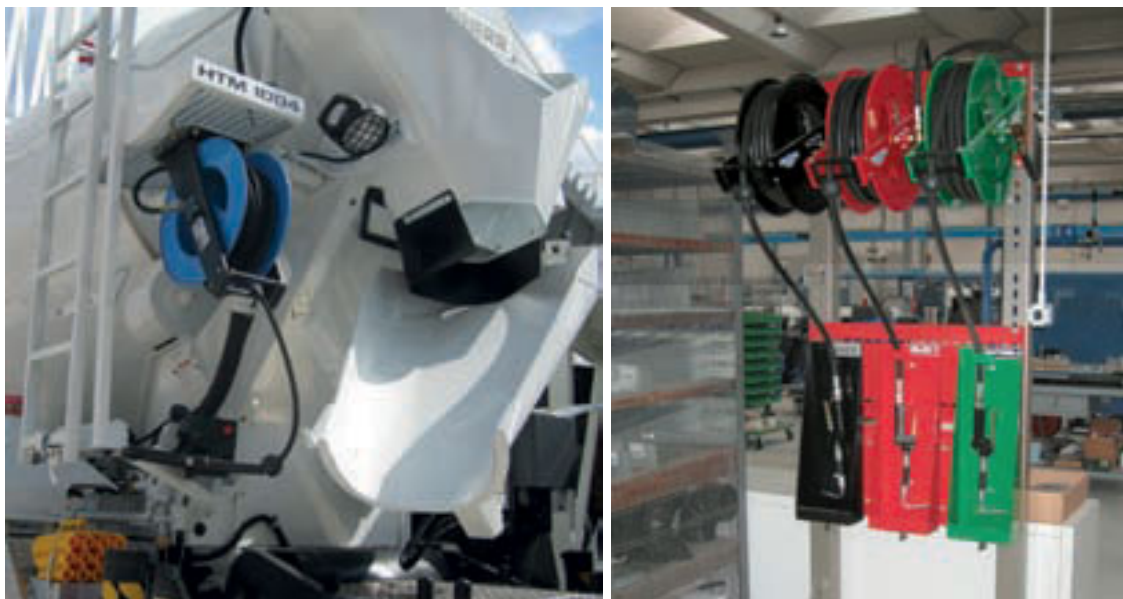
GEPRO version acier peint