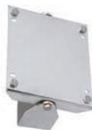
Embases pivotantes acier ou inox (option)